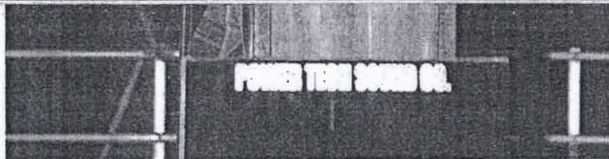
Irfaan Ali disse que o presidente Lula garantiu o apoio do Brasil à Guiana

Na última terça-feira, 05, o presidente da Venezuela chegou a detalhar perante à Assembleia Nacional do país sobre uma série de medidas a serem implementadas para que a adição da região acontecesse por meio de uma Lei Orgânica. A ideia é que Essequibo se torne um novo estado venezuelano. Entre as medidas, havia também a criação de um Alto Comissariado para a Defesa da Guiana Essequibo, contando com a participação de diferentes órgãos do governo, e um plano de Assistência Social aos moradores da zona em questão, para viabilizar a entrega de